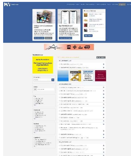
Marktkalender online: 1.223 toekomstige markten (sept. 2018)