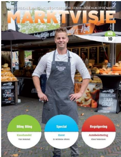
Vakblad Marktvisie: gedrukte oplage = 4.539 exemplaren (okt. 2018)