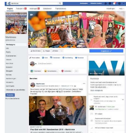
Marktvisie op Facebook: bijna 1.000 volgers (sept. 2018)

Op alle orders en leveringen zijn onze algemene leveringsvoorwaarden van toepassing, zoals gedeponneerd bij de Kamer van Koophandel te Leeuwarden onder nummer 01010690. Prijzen zijn per plaatsing in Euro bij kleurgebruik in zwart/wit of full colour, exclusief 21% BTW. Contractperiode: 12 maanden, ingangsdatum uitsluitend datum eerste plaatsing. Wijzigingen onder voorbehoud. Aan deze tariefkaart kunnen geen rechten worden ontleend.